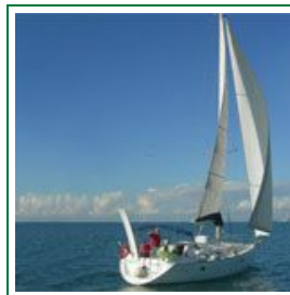
Escursioni in barca a vela nel Salento